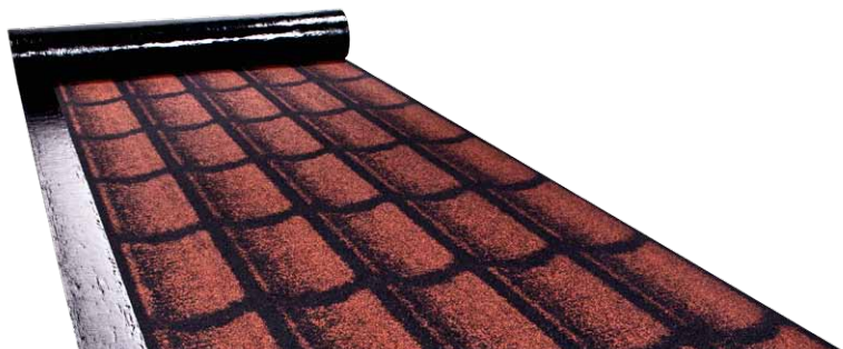
ICOPAL ROLLED TILES 3D® (RDI 3D® 11)