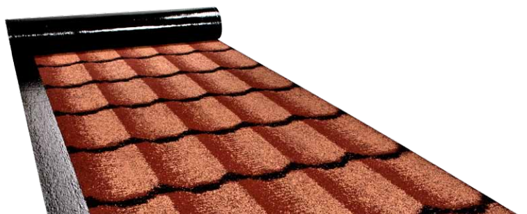
ICOPAL ROLLED TILES 3D® (RDI 3D® 13)