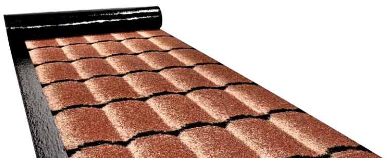
ICOPAL ROLLED TILES 3D® (RDI 3D® 24)