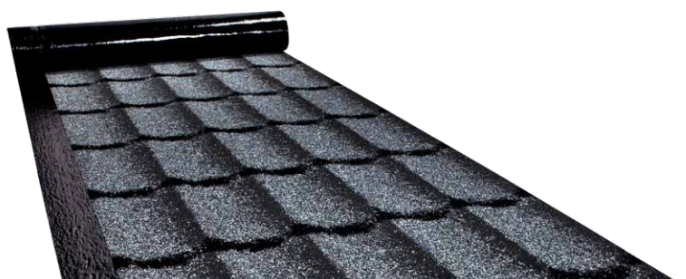
ICOPAL ROLLED TILES 3D® (RDI 3D® 15)