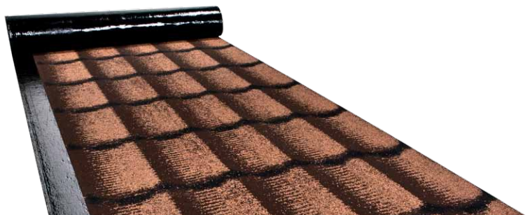
ICOPAL ROLLED TILES 3D® (RDI 3D® 12)